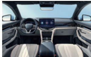
Blau und grau